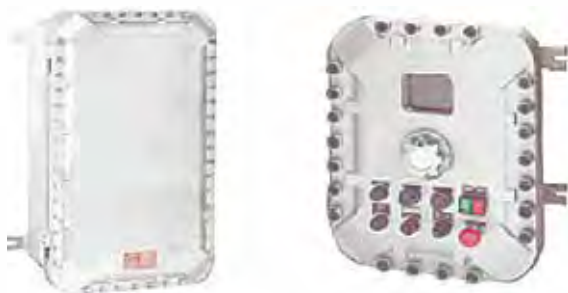
SERIE EXB QUANTUM

Clase I, Div. 1 & 2, Grupos. B*, C, D. Clase II, Div. 1 & 2, Grupos. E, F, G. Clase III. NEMA 3, 4, 7 BCD, 9 EFG