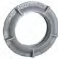
MIRILLAS SERIE GL/GLX