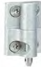
HINGE-10L Y HINGE-11L