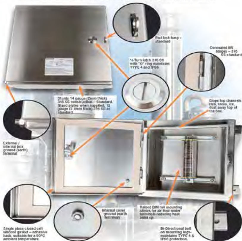
TERMINAL BOXES FOR HARSH & HAZARDOUS ENVIRONMENTS