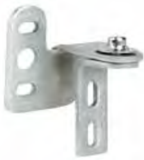
BISAGRAS 4 & 9 ACERO INOX.

Mirillas instaladas en fabrica redondas y rectangulares