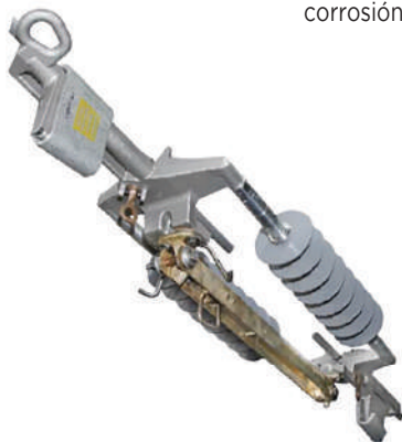
Conector para desconexión en línea viva.

Los conectores formados por un elemento en "C" hechos de aleación de aluminio de alta resistencia mecánica y de características eléctricas que cumplen con normas eléctricas como NMXJ170-ANCE, ANSI C 119.4 y ASTM B117-73 para el caso de resistencia a la corrosión.